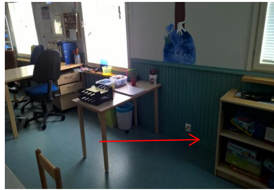
Kuva 2. Koira ilmaisi aktiivisesti ulkoseinän ala- osaan luokassa poutapirtti.