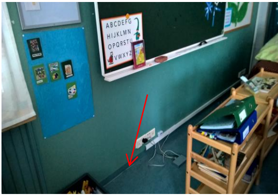
Kuva 1. Koira ilmaisi aktiivisesti väliseinän ja latti- an saumakohtaan luokassa poutapirtti.