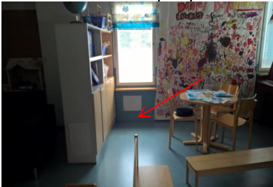
Kuva 3. Koira ilmaisi aktiivisesti ulkoseinän ala- osiin luokassa kaikumetsä.