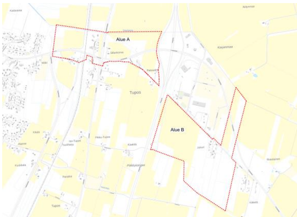
Kartta 2. Selvitysalueiden rajaukset