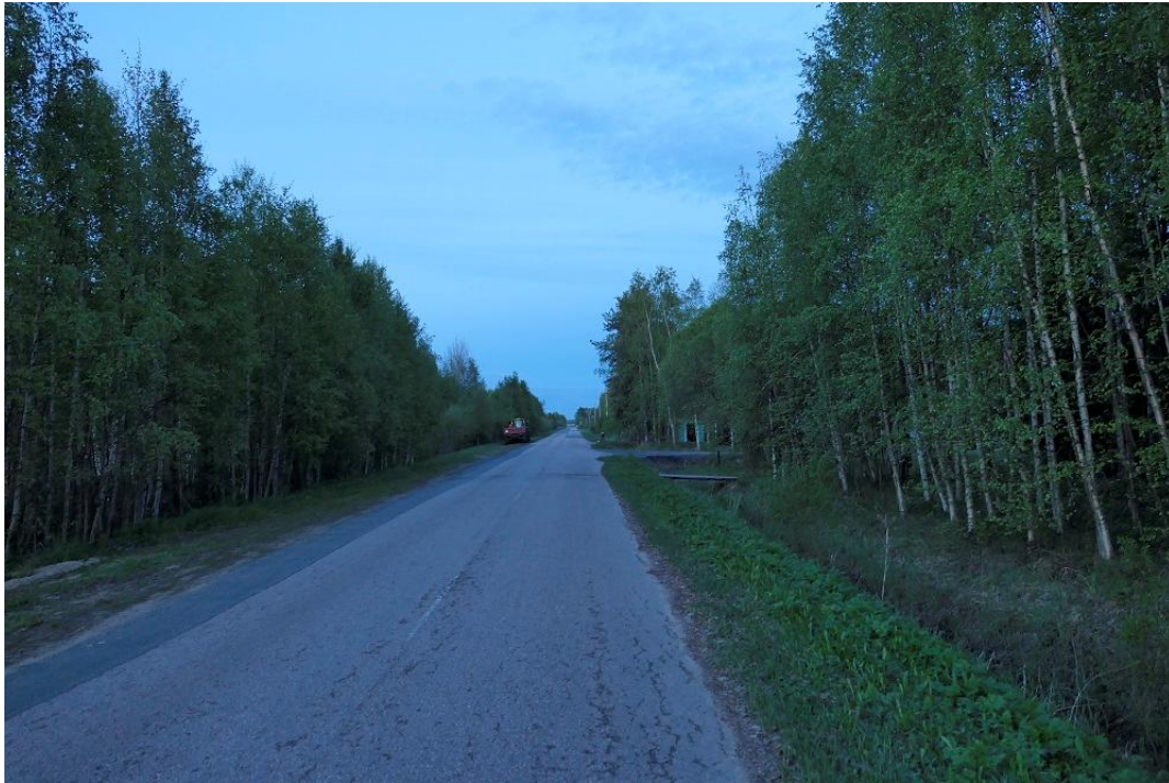
Kuva 4. Alue B:n itäosaa leimaavat nuorehkot koivumetsät. Jukulan kohdalla on vanhempia puurakennuksia.