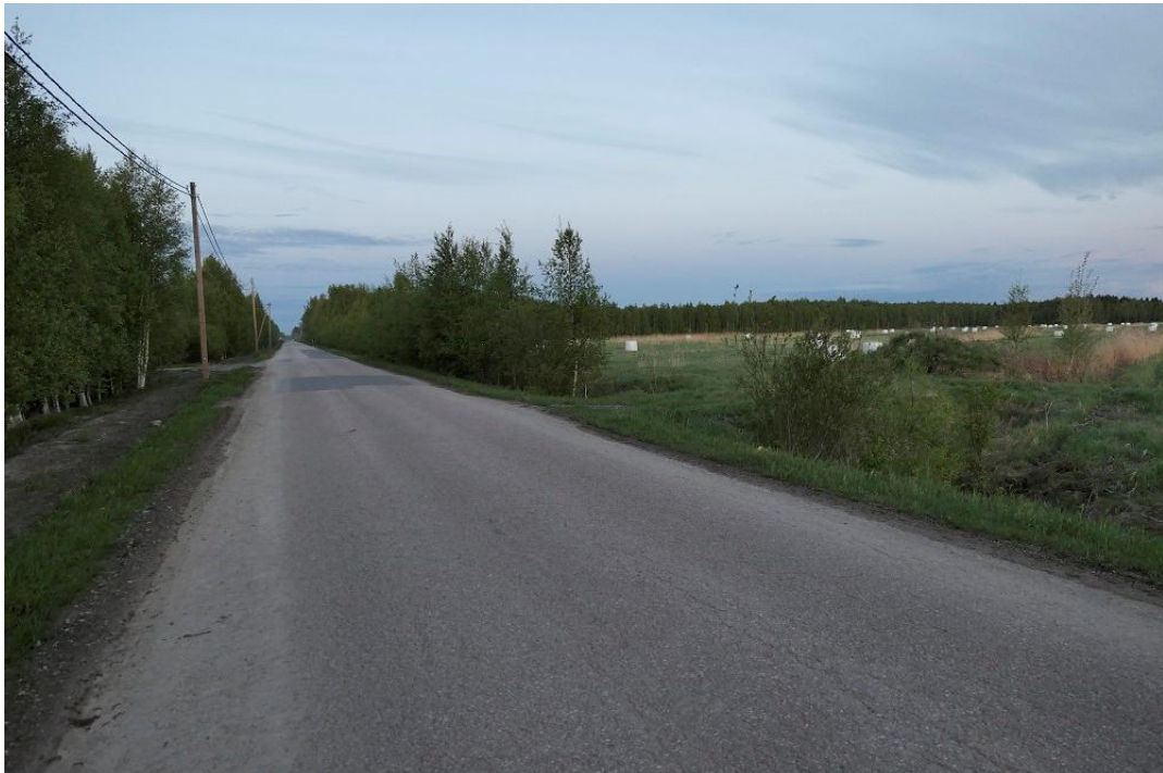
Kuva 3. Alueen B länsiosassa on peltoja ja se rajoittuu tiehen sekä pohjoisempaan olevaan logistiikka-alueeseen.

Alueella B ei havaittu lepakoita touko-, heinä- tai elokuun maastokäyntikerroilla.