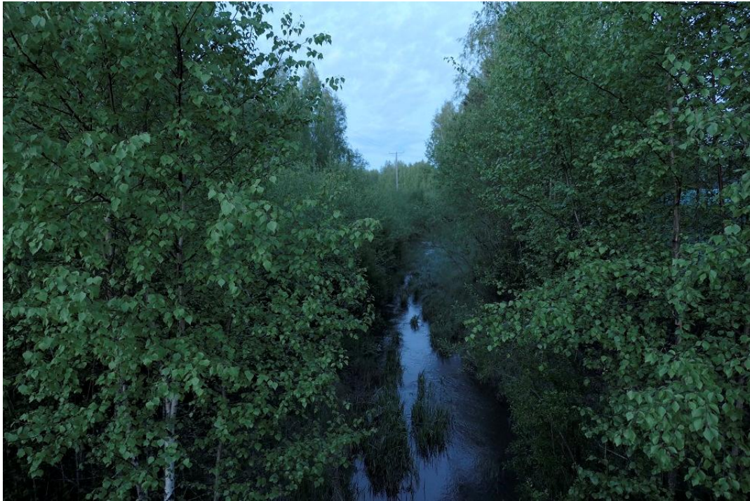
Kuva 2. Aluetta A läpi virtaa Peräoja.