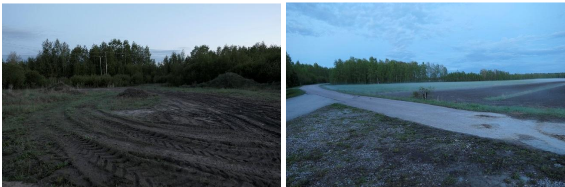
Kuva 1. Alueella 1 sijaitsee maanlajityspaikka, erikoikoisia pelloja sekä koivumetsää.

Alueella A ei havaittu lepakoita touko-, heinä- tai elokuun maastokäyntikerroilla. Alueella esiintyy useita vanhempia rakennuksia ja vaihtelevia ympäristöjä pelloista, metsistä, teistä ja talojen pihaluista (Kuva 1 sekä kansikuva). Aluetta läpi virtaa Peräoja (Kuva 2).