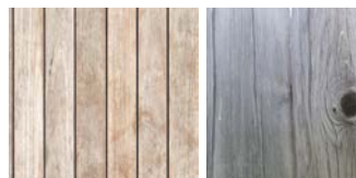
Julkisivun värimalli, käsittelemätön puu