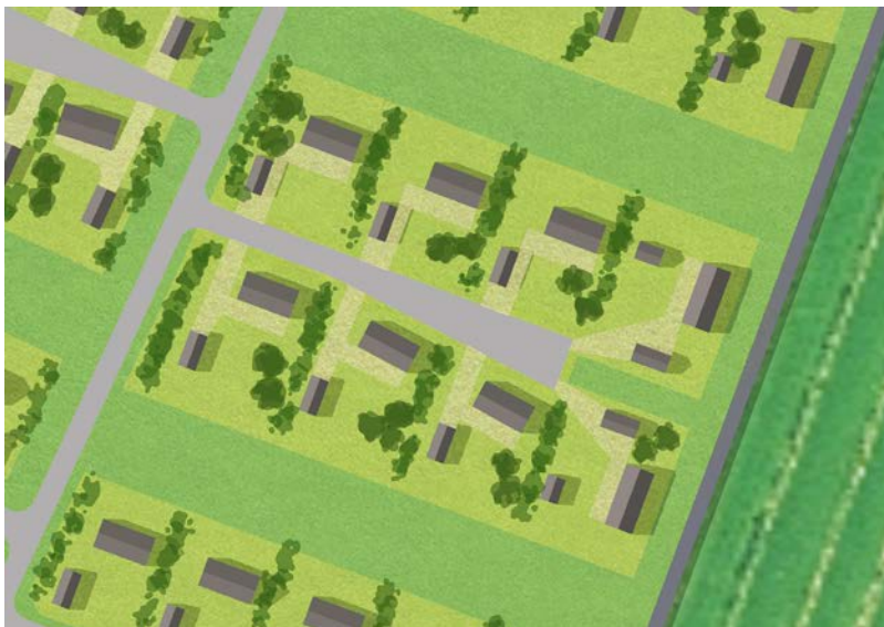
Periaatekuva rakennusten sijoittamisesta ja pihan jäsentelystä.

Pihan istutuksissa suositellaan käytettäväksi pääasiassa kotimaisia perinnekasveja ja puulajeja, jotka menestyvät alueella. Suositeltavia puulajeja ovat esimerkiksi koivu, haapa ja pihlaja. Pensasistutuksissa tulee suosia kotimaisia pensaslajeja ja hyötykasveja, kuten viinimarjapensaita ja syreenejä. Korkeat ja peittävät havupensasaidat eivät sovellu alueelle. Istutukset tulee sijoittaa ryhmiin tai rajaamaan oleskelupihaa.