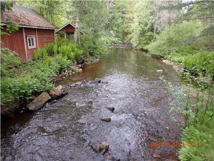
Kuva 4. Koskenniska soraistetaan kauttaaltaan. Uoman reunoilla olevia syvännekuoppia soraistetaan.