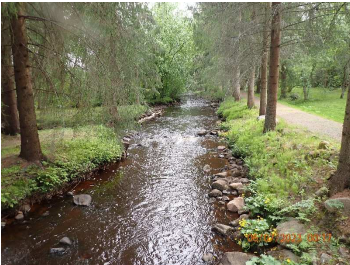
Kuva 7. Sora tuodaan paikalle traktorin etukauhalla.