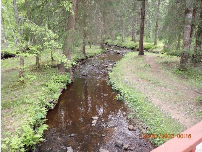
Kuva 6. Alueella olevia pienempiä uomia soraistetaan. Tarvittaessa sorakoiden ympärille asetellaan suojakiviä, jotka löytyvät uomasta.