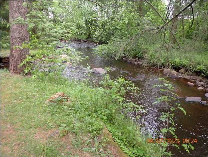
Kuva 2. Rantaväylän oma soraistetaan, väylän yläpään siirrellään stopparikiviä. Hidasvirtaisia syvännukuoppia soraistetaan.