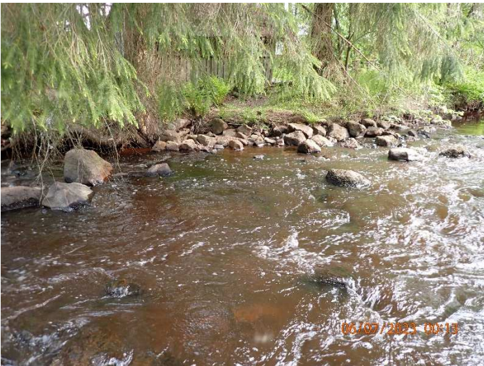
Kuva 5. Ison kuusen varjostama koskipätkä soraistetaan.