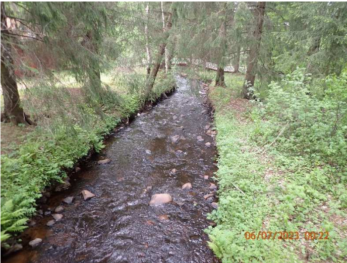
Kuva 3. Soraa lisätään koko uoman leveydeltä, sorakoiden ympärille asetellaan uomasta löytyviä suojakiviä.