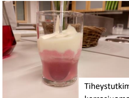
Tiheystutkimus kerrosjuoman avulla

Oppiaineen sisällöt liittyvät niin ruoanvalmistuksen ilmiöihin kuin kodin kemikaaleihin perehtymiseen. Oppitunneilla tutkitaan kemiaa esimerkiksi valmistamalla erilaisia syötäviä leivonnaisia tai ruokia, tekemällä kemiallisia kokeita ja vertailemalla erilaisia puhdistusaineita. Tunnit pidetään pääsääntöisesti kotitalousluokassa.